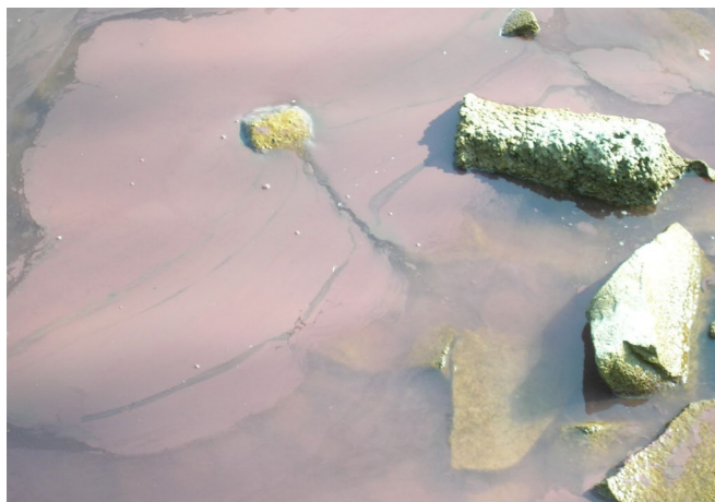
Abb. 3: Das „Burgunderblut-Phänomen“: An der Wasseroberfläche bildet die Burgunderblutalge einen rötlichen Film.

Bei einer vollständigen Durchmischung des Sees werden die Gasvesikel durch den zunehmenden hydrostatischen Druck der Wassersäule zerstört (Abb. 2 [1a-2a]). Die stärksten heute bekannten Gasvesikel [1], widerstehen dem Wasserdruck bis in eine Tiefe von ungefähr 100 Metern (maximale Tiefe Bodensee-Obersee: 251 Meter). Die Zellfäden gelangen dann aus der Tiefe nicht mehr in