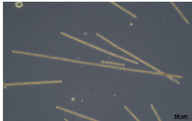
Abb.1: Unter dem Mikroskop sind die bis zu millimeterlangen, unverzweigten Zellfäden der Burgunderblutalge sehr gut erkennbar.